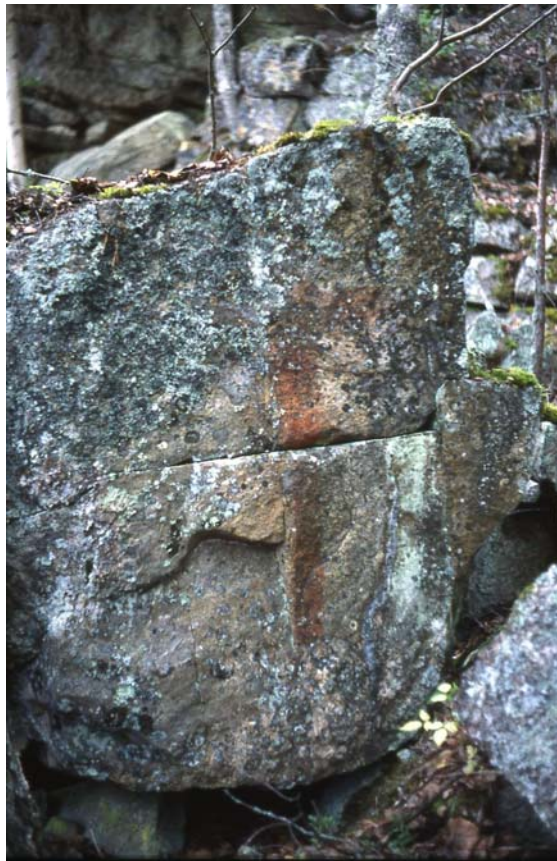
Kuva 5. Irtolohkareeseen maalattu punainen risti on yläosaltaan jäkälän peitossa.

Tutkittuamme Kirkkokallion lähdimme jatkamaan eteenpäin, tarkoituksenamme kulkea Karhusaaren ja Siekkisensaaren välissä olevan kapean Virransalmen läpi. Vesireitti oli kuitenkin kuiva, joten pitkän kiertomatkan välttämiseksi päätimme kantaa veneen yli kannaksen Simpiänselän puolelle.