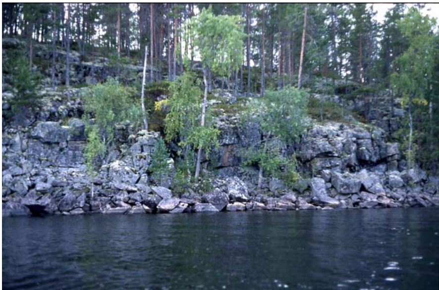
Kuva 2. Rantakoivujen välissä näkyvässä kalliopinnassa oli punaista värjäytymää.