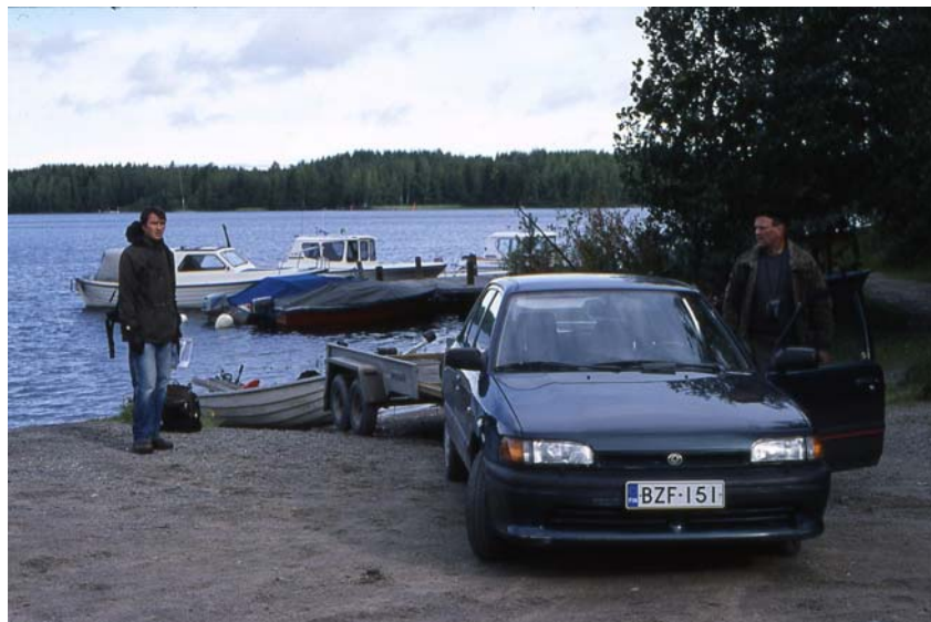
Kuva 1. Veneenlaskupaikka Mainiemessä.

Inventoitava alue oli kooltaan noin 6 x 7 kilometriä ja osa siitä on rantojensuojelualuetta. Veneen vesillelaskupaikaksi valitsimme tutkittavan saariryhmän eteläpuolella olevan Mainiemen venerannan.