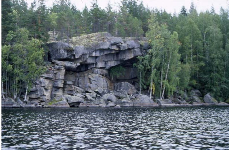
Kuva 4. Kirkkokallion ylälipa muodostaa suojaavan katoksen. Kiveen maalattu risti sijaitsee kuvan oikeassa reunassa olevassa tiheikössä.