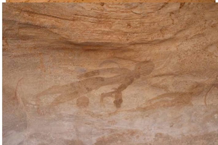
Kuva 4. Pyöröpääfiguureja Tin-Tsatsariftissa.