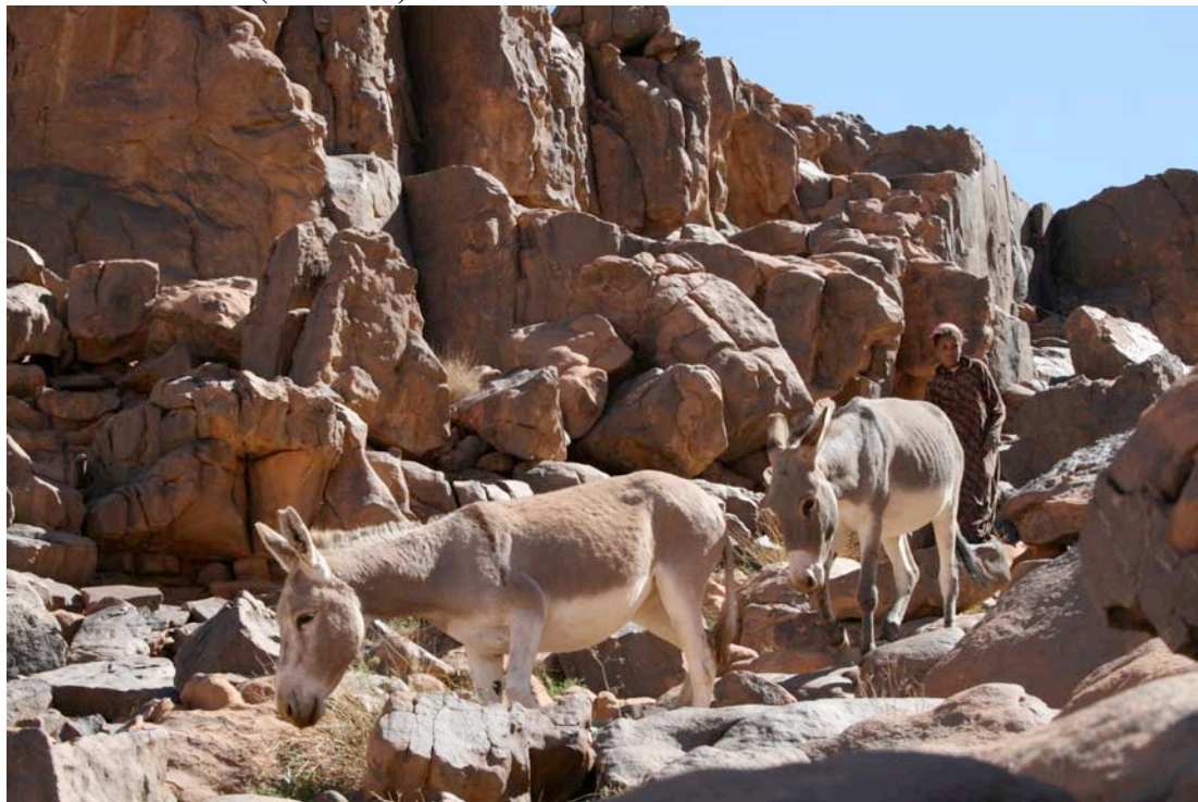
Kuva 10. Onnellinen nomadityttö.

Tassilin yläköalueella asuu edelleen nomadeja. Heillä on kotina usein luola kallion kainalossa, joka tarjoaa suojaisan paikan ruuan valmistamiseen. Kotieläimille on rakennettu risuista aitaus. He asuvat lähes samoin kuin kivikauden ihminenkin oletettavasti asui. ( kuva 10.)