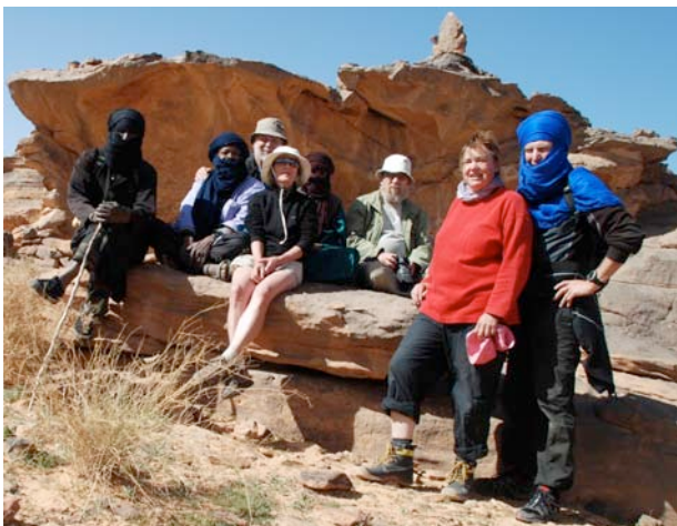
Kuva 7. Oppaat ja me.

olivat tavaroiden kuljettamiseen, eivät ratsastamiseen, joten matkasimme jalan kaiken kaikkiaan vajaat 300 km.