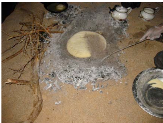
Kuva 8. Leipä paistuu nuotiossa.

vedentarpeeseen ja sillä sai myös hampaat harjattua. Muuten peseytyminen sujui Suomesta ostetuilla vauvapyyhkeillä. Veden lisäksi repussa oli painolastina kamerat, itselläni oli kaksi digikameraa sekä 1 videokamera paikkojen ja kuvien dokumentointiin, kuvia kertyikin parisen tuhatta. A4:n kokoinen aurinkopaneeli oli pistämätön apu kameroiden ja lamppujen akkujen lataamiseen. Illaksi piti aina ehtiä uuteen leiripaikkaan ennen auringon laskua klo 18 koska auringon laskettua autiomaassa ei näe mitään ilman tasku- tai otsalamppua. Teltat piti ehtiä pystyttää valoisan aikaan. Kamelit päästettiin vapaiksi yön ajaksi jotta ne pääsivät etsimään syötävää: piikkisiä akaasiapensaita, heinätuppoja yms. Kuuden aikaan oli tuaregiteen aika ja 19-20 syötiin illallinen leirinuotion valossa.