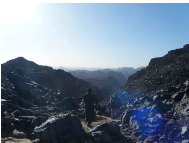
Kuva 1. Tefatst-sola

Kohteenamme oli Tassili N´Ajjerin yläkööalue Algerian kaakkoisosassa lähellä Libyan, Tsadin ja Nigerin rajoja. Koko valtava 80 000 neliökilometrin laajuinen alue on määritetty luonnonpuistoalueeksi 1972 ja on Unescon maailmanperintökohde vuodesta 1982 lähtien. Korkeuserot yläkööalueella ovat 500-2200 metriin. (kuva 1.)