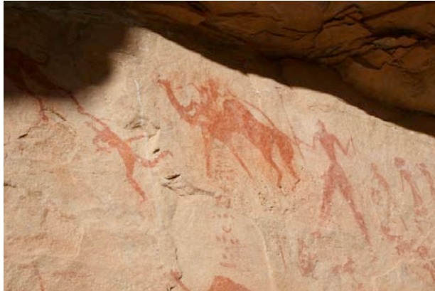
Kuva 6. Kameli- ja ihmisfiguureja In-Itinessä.