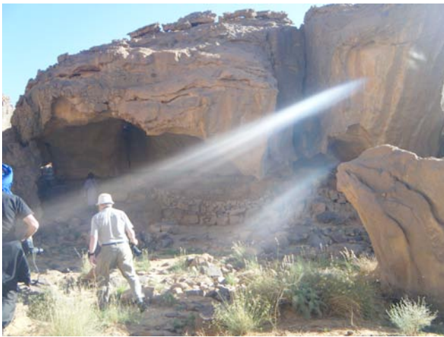
Kuva 5. Maalauksia oli mitä hienoimmissa paikoissa.